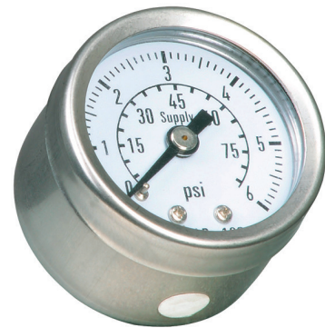
Bild 1: Manometer „Supply“, äußere Skala 0 bis 6 bar, innere Skala 0 bis 90 psi