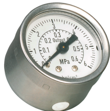
Bild 2: Manometer „Output“, äußere Skala 0 bis 6 kg/cm 2 , innere Skala 0 bis 0,6 MPa