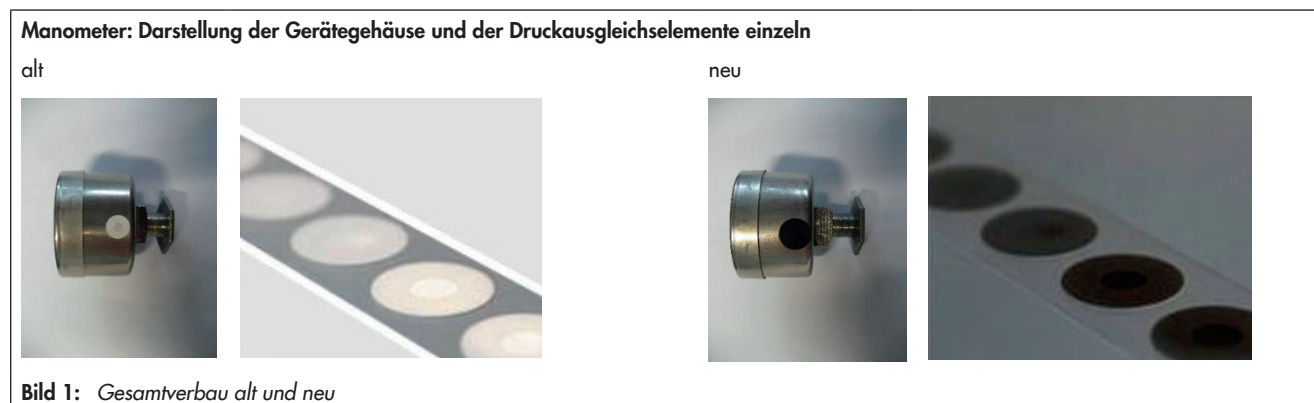
Tabelle 1: Betroffene SAMSON-Geräte und -Artikel

Den Einsatz dieser Druckausgleichselemente an Gehäusen von Elektrogeräten hatte SAMSON zur gleichen Zeit in der Vorserie gestoppt. Auch hier sind die Werkstoffe bereits ausgetauscht.